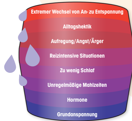
Grafik: Überschreiten der Migräneschwelle

Migränebetroffene weisen eine besondere Art der Informationsverarbeitung auf. Es handelt sich sozusagen um ein „Hochleistungs-Gehirn“, dem es schwer fällt, sich von äußeren Reizen abzuschirmen und das einen hohen Energieverbrauch hat. Entsteht eine Überlastung des Systems, kann es zur Überschreitung der sog. „Migräneschwelle“ kommen.